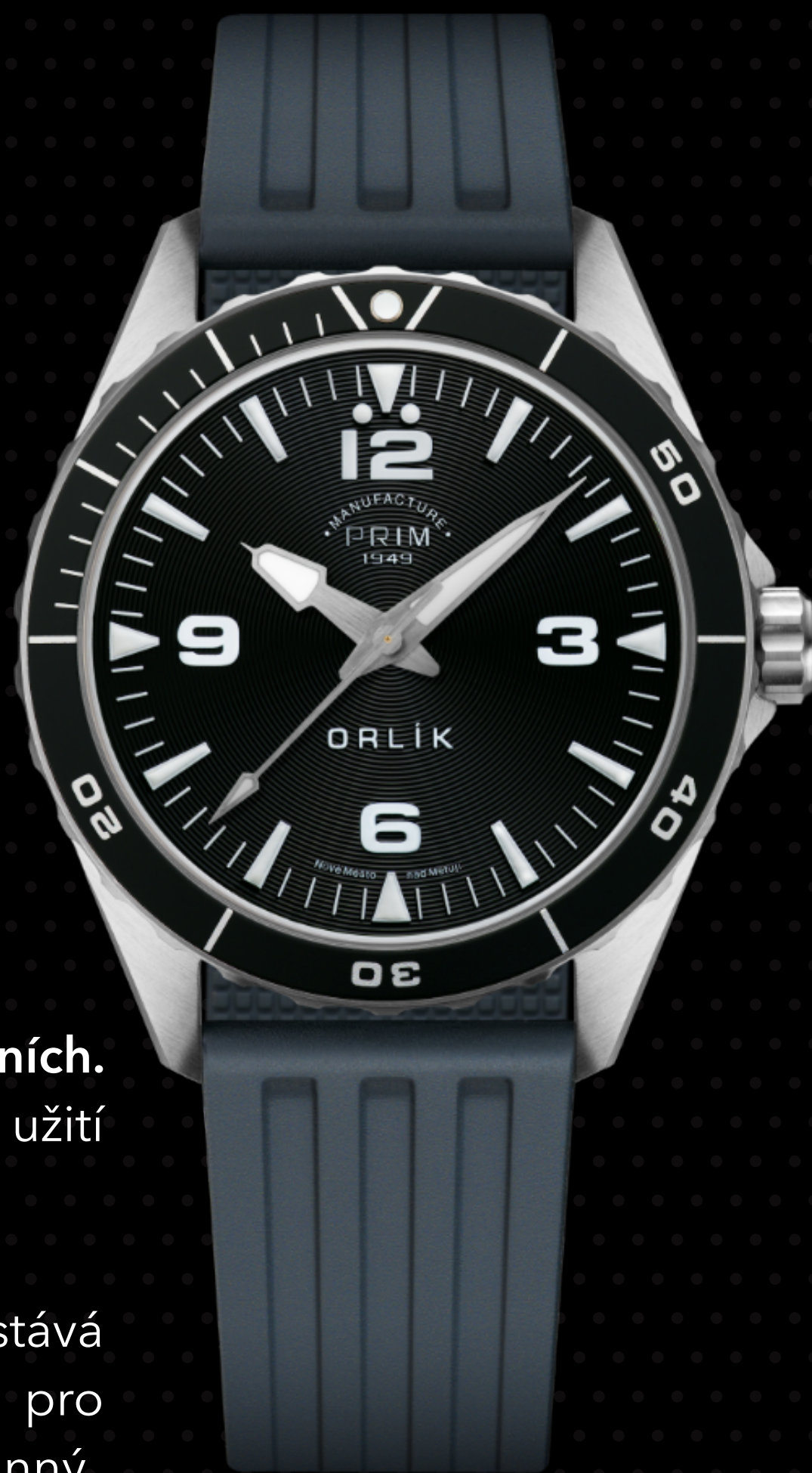
nerezová ocel 316L